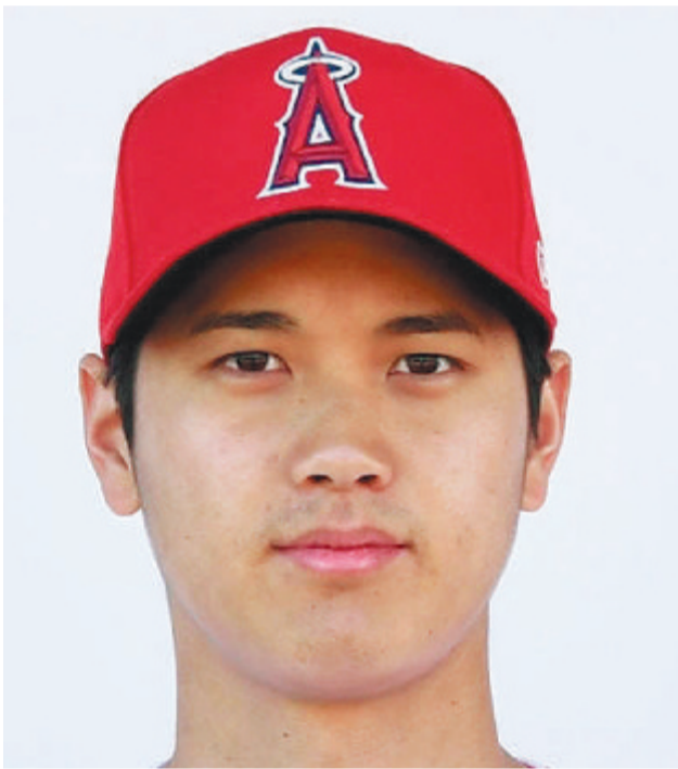
エンゼルスの大谷翔平